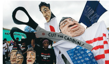
Klimatprotester vid pågående FN-möte i Bangkok.